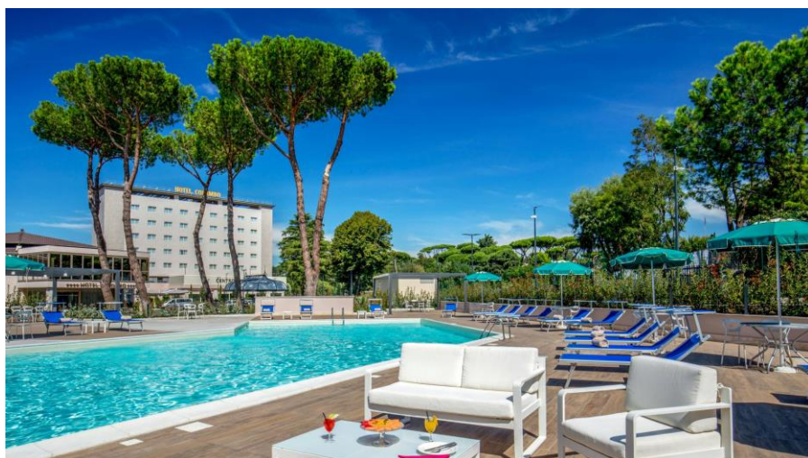
Sistemazione a Roma: Hotel Cristoforo Colombo (nella foto)

Bevande (tranne alla cena a Trastevere), ingressi e quanto non indicato sotto la voce "comprende"